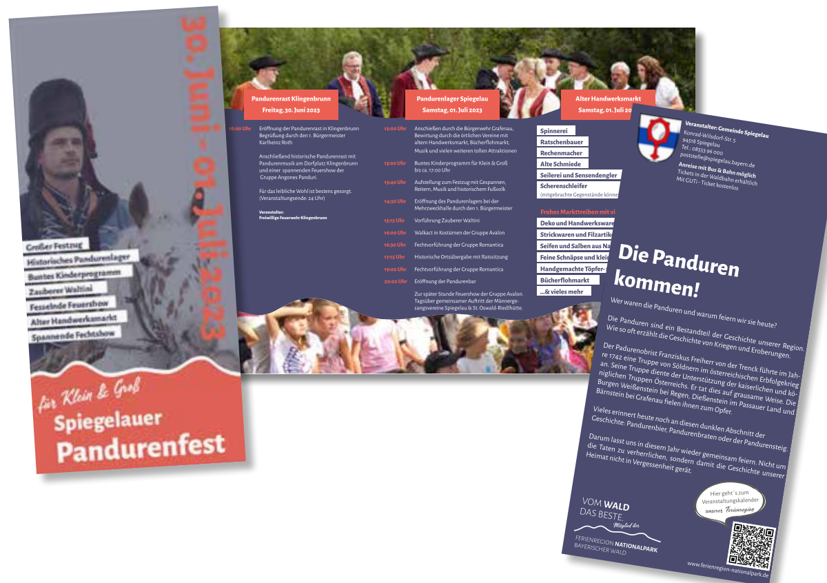
Folder / Wickelfalz, Din lang (geschlossen)