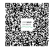
QR-Code für die online Buchung

Eine Anmeldung von Gästen aus Orten ohne Verkaufsstelle erfolgt online oder telefonisch über die Tourist-Info Bayerisch Eisenstein, Tel.: 09925 9019-001, bayerisch-eisenstein@ferienregion-nationalpark.de. Online Buchung: www.boehmerwaldcourier.eu Die Anmeldung ist bis zum Vortag 15 Uhr möglich.